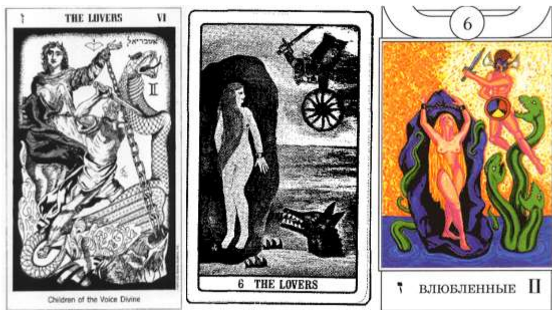
Рис. 5. Сюжет спасения Андромеды в Таро Доусона, Уэнга, Цицero

знакомых нам по марсельской колоде и колоде Уэйта образов, сюжет освобождения Андромеды Персеем, который впоследствии встречается в других колодах, связываемых с Золотой Зарёй. Таро Доусона стало, вероятно, первой опубликованной колодой, в которой для данного аркана использован этот сюжет, хотя Р. Уэнг, издавший свою колоду примерно в то же время, что и Доусон, возводит его происхождение напрямую к материалам Золотой Зари и приводит подробное каббалистическое обоснование использования этого сюжета, связанное с аналогией Зайн = Меч. 19 Как и Младшим Арканам, каждому из Старших Арканов в колоде Доусона дано дополнительное развёрнутое наименование, взятое из таблицы, приведённой в статье 1912 года, 20 с небольшими изменениями.