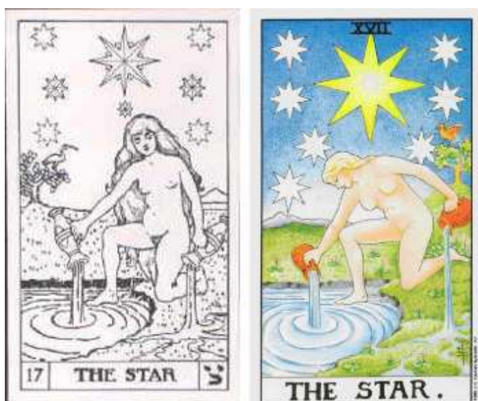
Рис. 3. Аркан XVII в Таро Кейса (слева) и в Таро Уэйта (справа)

Важно отметить, что, несмотря на то, что в плане изображений арканов колода Кейса является, во многом, вторичной относительно Таро Уэйта, интерпретации Кейса вполне самостоятельны. Это хорошо заметно на примере Аркана VI (Влюблённые), изображение которого Кейс полностью заимствует у Уэйта, но интерпретирует в терминах духовной алхимии, и в том, что касается истолкования этой карты, «сходства весьма незначительны и там, где Кейс говорит об объединении противоположностей Духовным Началом (Spiritual Self), Уэйт указывает лишь на связь с Эдемским садом». 16 Младшие арканы в колоде Кейса выполнены максимально просто и лишены сюжетных изображений, а для передачи смысла использован геометрический символизм. Структура Карт Двора соответствует Таро Уэйта и марсельской колоде. Однако