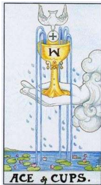
Рис. 1. Туз Кубков в Таро Уэйта

Наиболее известной на сегодняшний день колодой, связанной с орденом Золотой Зари является «Таро Райдера-Уэйта», также называемая иногда «Таро Уэйта-Смит», по имени художницы Памелы Колман-Смит, которой были сделаны изображения арканов. Колода была опубликована в 1910 году. А. Уэйт являлся членом Золотой Зари, однако следует учитывать, что в 1903 году Уэйт покинул организацию Мазерса и стал руководителем собственной оккультной организации «Независимый и исправленный орден R.R. et A.C.». Таким образом, помимо идей первоначального ордена, колода содержит и оригинальные разработки Уэйта, тяготевшего к христианскому мистицизму. Это хорошо заметно, например, на карте Туз Кубков, использующей тему причастия, в VI Аркане (Влюблённые), изображающем Адама и Еву в Раю, а также в некоторых других изображениях Арканов.